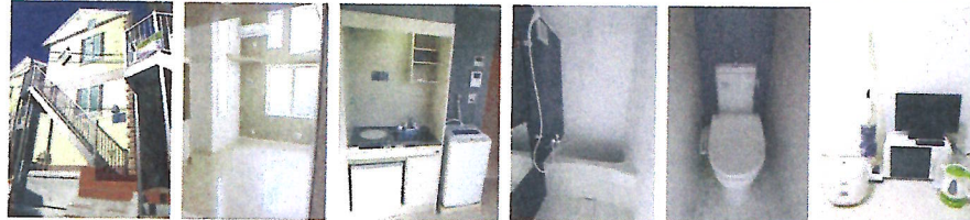
南仏風の外観 明るい室内 ミニ冷蔵庫付 浴室 トイレ あったら嬉しい 新品家電付

フリーレント1ヵ月! オススメポイント セブンイレブン徒歩5分 二人入居・ルームシェア可能 家電7点セット無料、 オシャレなロフト付 デザイナーズアパート、新築