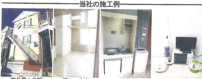
断面図 南仏風の外観 明るい室内 ミニ冷蔵庫付 家電付