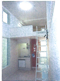
天井高約3.7m ロフト天井高約1.4m